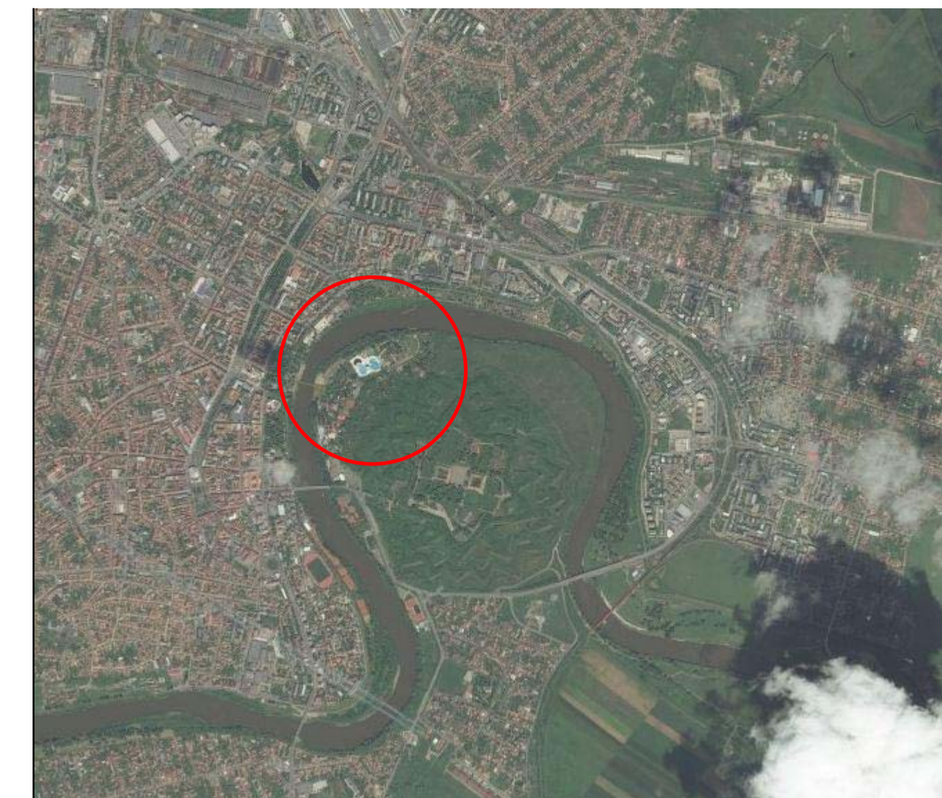
INCADRARE IN LOCALITATE