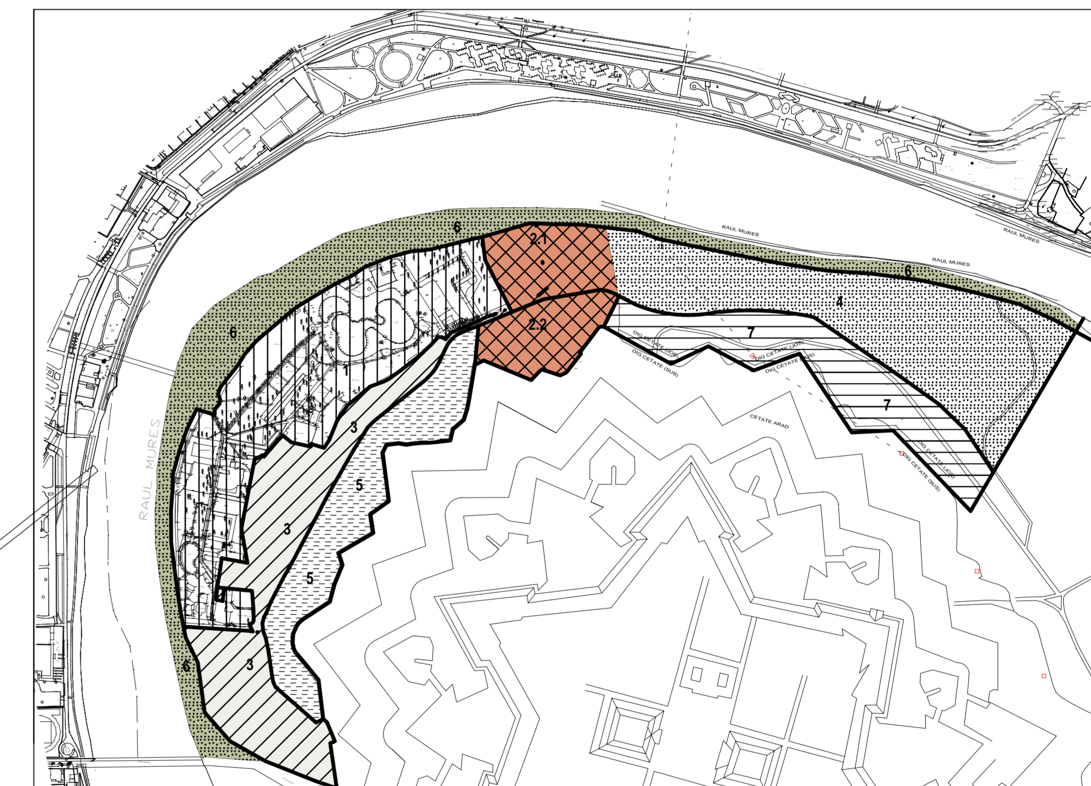
ZONIFICARE PROPUSA SC.1:5000